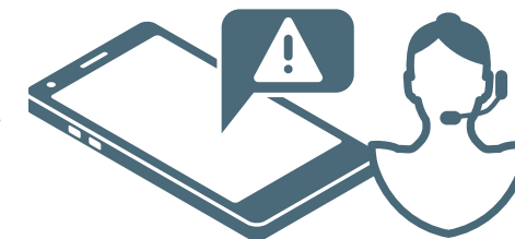
ALERTE SUR SMARTPHONE, PAGER, CENTRE SPÉCIALISÉ